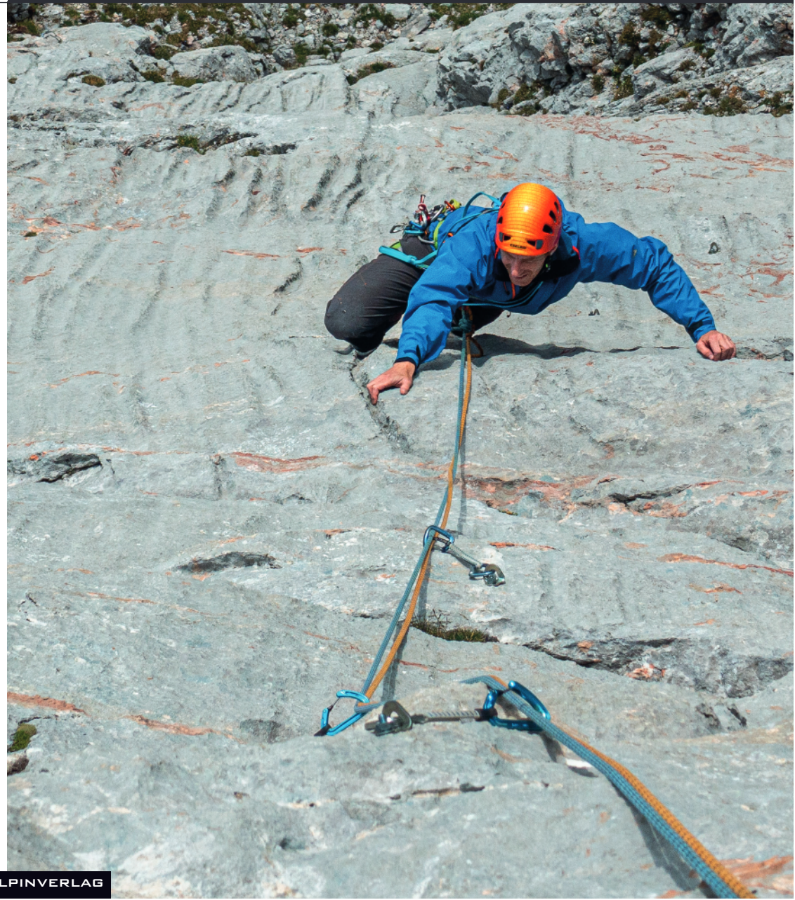
Wandfoto von Rudi Kühberger aus dem Kletterführer Hochkönig © Panico Alpinverlag 2022