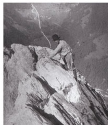
König Albert I Tannenspitze, 1934

In den Engelhörnern, dem traditionsreichsten reinen Felsklettergebiet des Berner Oberlandes, wurde Klettergeschichte geschrieben. Man kann hier an den jeweiligen Erstbegehungen die schrittweise Entwicklung vom ursprünglichen Bergsteigen bis hin zur rein sportlichen Form des Kletterns nachvollziehen. Dabei versteht man die jeweils neuen Tendenzen nur, wenn man die vergangenen kennt. Deshalb der Versuch, in geraffter Form die wichtigsten Entwicklungsschritte mit ihren Protagonisten chronologisch aufzuzeigen.