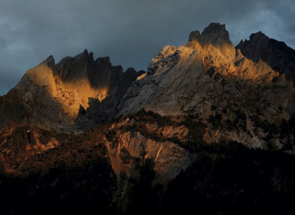
links: Klein und Gross Simelstock rechts: Rosenlaustock