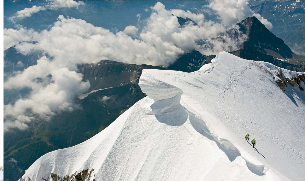
▲ Fast am Ziel: Seilschaft auf dem Mont Blanc de Courmayeur.

Route: Von der Biwakschachtel steil auf den Glacier de la Brenva hinab. Ein Fixseil oder auch Abseilen hilft. Ohne Höhenverlust nach S auf den Col Moore zu (Spalten in Gehrichtung!) Vom Col Moore über kombi-