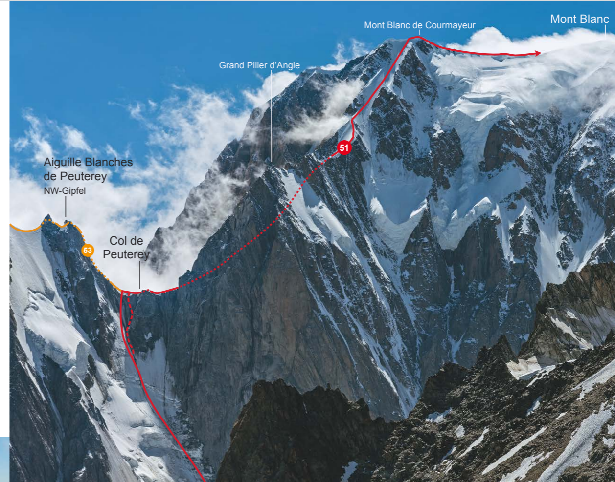
▲ Die Brenva-Flanke des Mont Blanc.

▼ Bei Traumverhältnissen durch das Couloir Eccles zum Beginn des verfirnten oberen Gratteils.