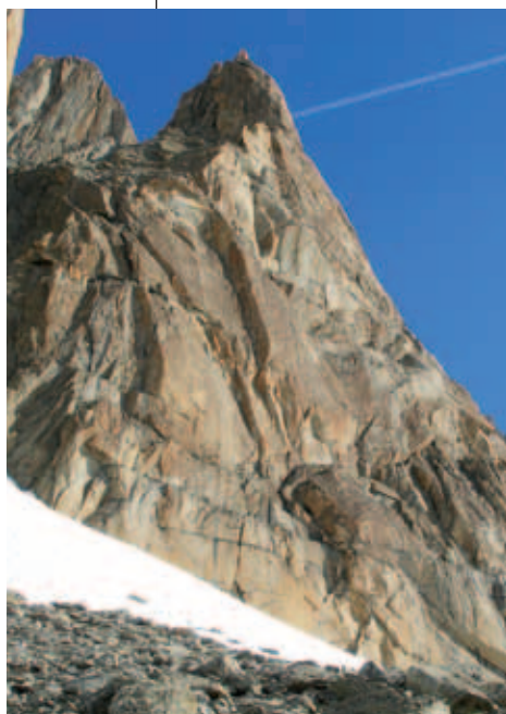
Aiguille du Génépi