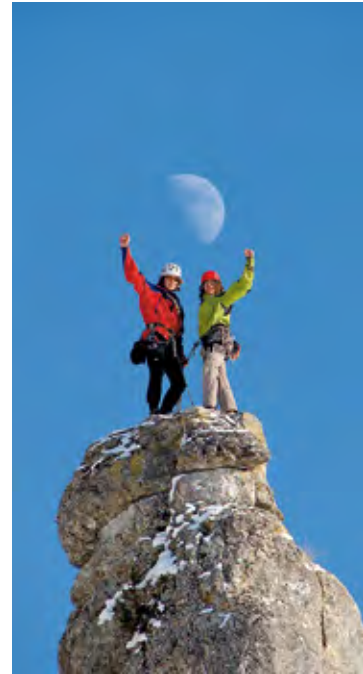
Zur rechten Zeit am rechten Ort. Abendstimmung am Spitzen Stein.

In der Spalte nach der Exposition ist die Anzahl der Routen angegeben und – durch die Farbfelder (analog zur Farbcodierung der Routenlinien) verdeutlicht – die für den Fels charakteristische Schwierigkeitsverteilung. Sprich: Wo ein Farbfeld fehlt, ist in diesem Schwierigkeitsbereich wenig bis nichts zu holen.