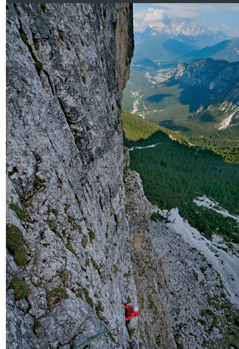
▼ Hoch über dem Schwarzwald der Dolomiten. Im Hintergrund die Civetta.