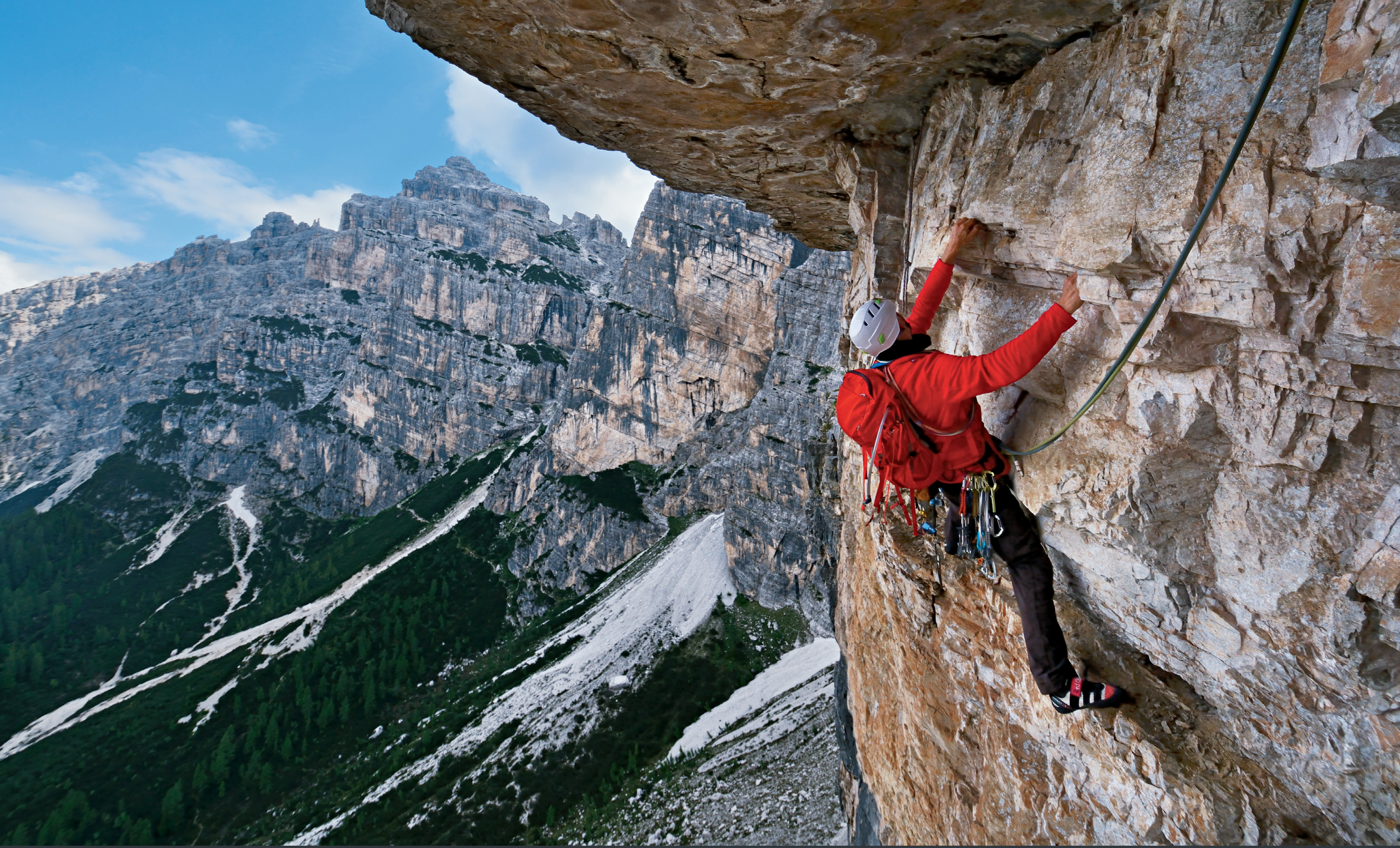
▲ Fotogene Schlüsselstelle: der Quergang in der 7. Seillänge (VII-).