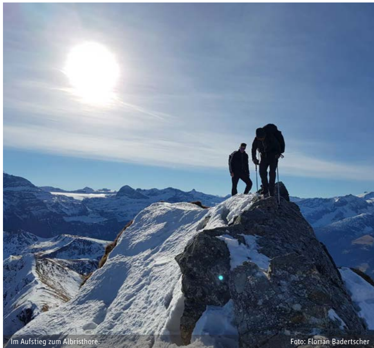
Im Aufstieg zum Albristhore.