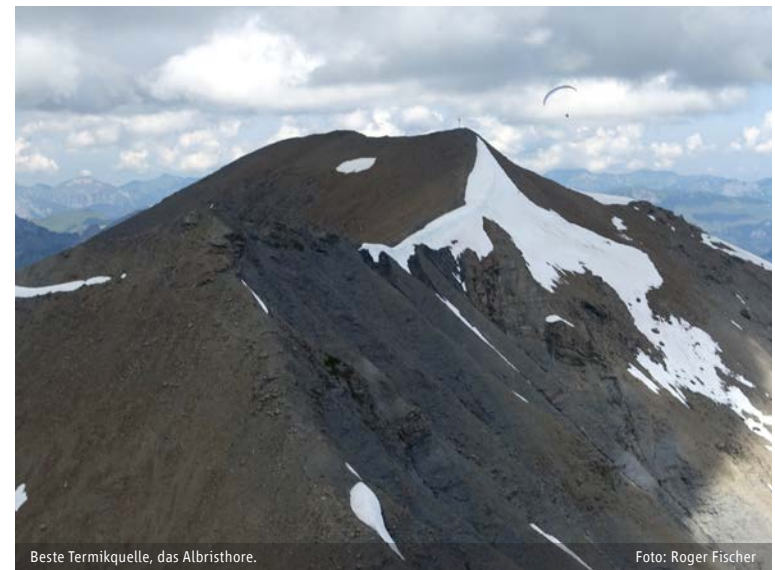
Beste Termiquelle, das Albristhore.

In Färmel there is no official landing field, still, there are good options; choose a mown meadow, just watch out for overhead cables leading to nearby houses. In strong valley wind (esp. N wind), landings in Adelboden can be difficult. S Föhn is not good here. Flights to Frutigen are only recommended at height. Engstligental, between Adelboden and Frutigen is unsuitable for landings. For cross-country flights consider the airfields St. Stephan, Zweisimmen, Saanen and Reichenbach, as well as heliport Gstaad (check the SHV info board).