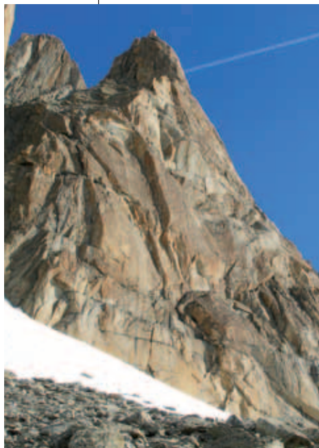
Aiguille du Gënëpi