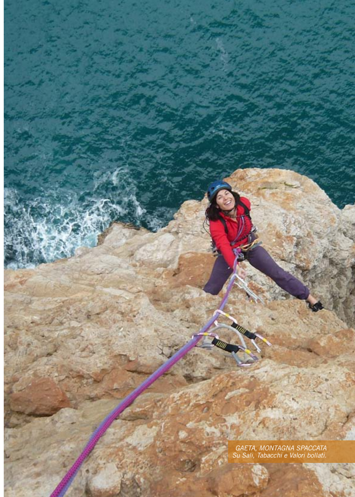
GAETA, MONTAGNA SPACCATA Su Sali, Tabacchi e Valori bollati.