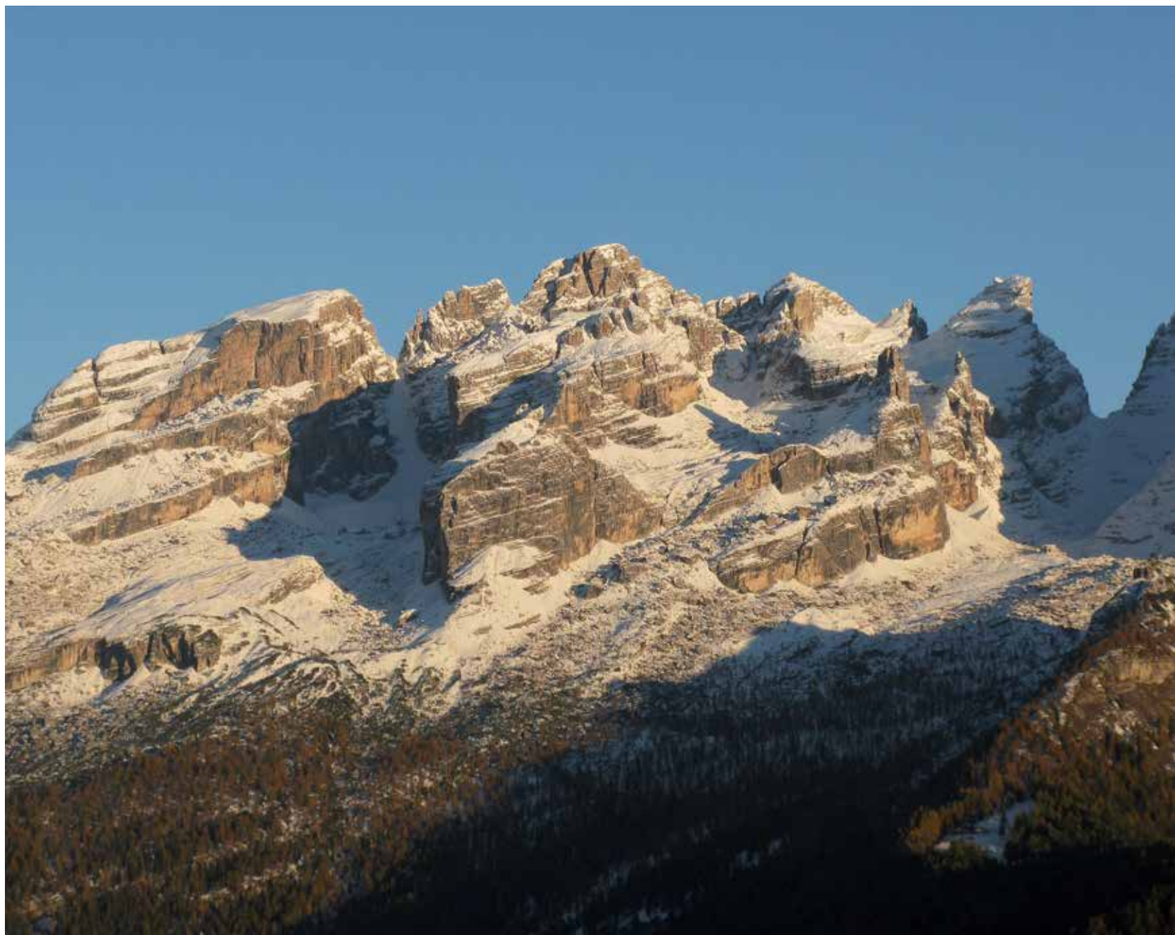
Il Brenta da ovest