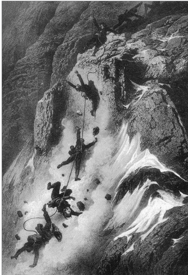
Gemälde von Doré

Er kann nun hinabklettern, braucht aber all seine Erfahrung als langjähriger Bergretter, um zunächst einmal die Verletzten vorläufig zu versorgen, sie aus dem steinschlaggefährdeten Bereich und dann noch Richtung Hütte zu bringen, aus der ihm daraufhin Helfer entgegenkommen. Die Bilanz des Absturzes: Die beiden jungen Bergsteiger haben neben einem schweren Schock am ganzen Körper starke Prellungen und Abschürfungen erlitten, einer darüber hinaus eine gebrochene Rippe davongetragen. Anderl Heckmair aber hat es besonders schwer erwischt: Eine Schulter ist ausgekugelt, mehrere Rippen gebrochen, ja sogar Halswirbel und Lendenwirbel sind eingerissen und auch ein Schlüsselbein ist angebrochen. Dazu noch die vielen Prellungen und eine große, blutende Wunde am Kopf! (siehe auch: Halber Akia mit Fahrgestell).