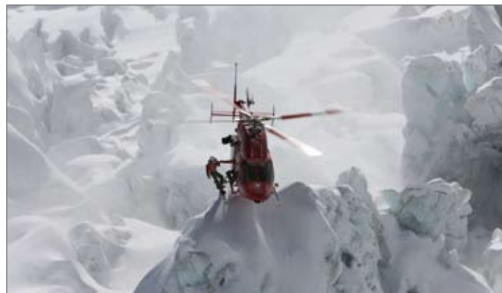
Im vollen Einsatz – Die Profis der Air Zermatt

2011 gegründet, unterstützt die Stiftung unter anderem den Aufbau der Luftrettung im Himalaya. Bei diesem Projekt bilden erfahrene Einsatzkräfte aus Zermatt beispielsweise vor Ort Retter und Piloten aus.