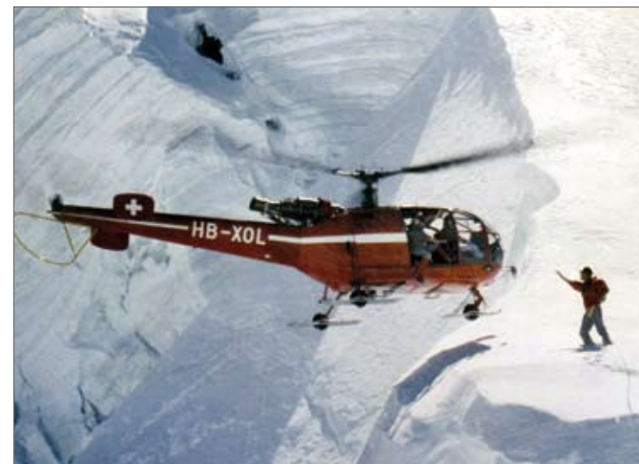
Die Alouette III im Einsatz