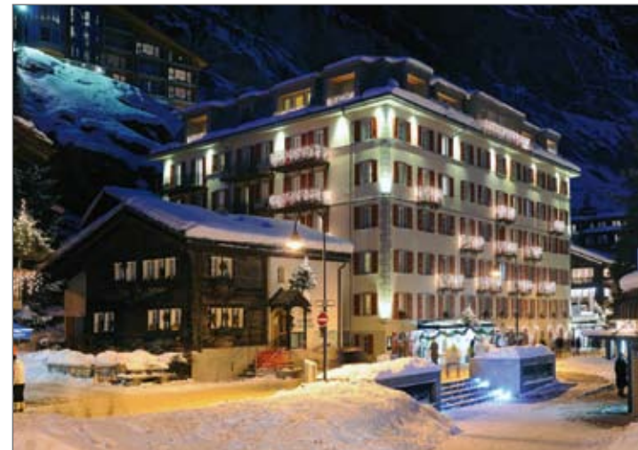
Das Hotel Monte Rosa heute