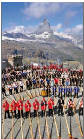
Alphörner am Gornergrat

Anlass ist das 111. Jahr des Bestehens der Gornergrat Bahn ; die Veranstaltung kommt damals bei Besuchern und Alphornbläsern so gut an, dass viele ihr Mitwirken bei einem weiteren Rekord bereits in Aussicht stellen. So kann dann die Bahngesellschaft im Sommer 2013 ihren eigenen Rekord noch mal toppen, als sie zum 115. Jubiläumjahr mehr als 500 Alphornbläser am Gornergrat zusammenbringt.