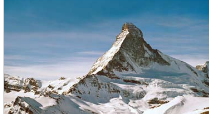
Die Nordostseite des Matterhorns

Bei guten Verhältnissen gibt es im Abstieg am Hörnligrat eigentlich keine Stelle, wo sich das Abseilen lohnt. Dass sich trotzdem Hunderte von Abseilschlingen dort finden, weist auf möglicherweise schlechte Bedingungen und/oder auf die größere Unsicherheit bei nicht ganz so geübten oder aber entkräfteten Bergsteigern hin.