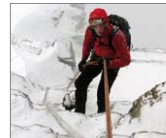
Abseilen im Schnee

Bei guten Verhältnissen gibt es im Abstieg am Hörnligrat eigentlich keine Stelle, wo sich das Abseilen lohnt. Dass sich trotzdem Hunderte von Abseilschlingen dort finden, weist auf möglicherweise schlechte Bedingungen und/oder auf die größere Unsicherheit bei nicht ganz so geübten oder aber entkräfteten Bergsteigern hin.