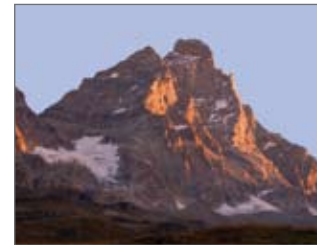
Die Südseite im Abendlicht

So viele Anläufe mehrerer Bergsteiger und Führer sind nötig, bevor der Gipfel des Matterhorns erstmals durch Whymper und Gefährten erreicht werden kann. Allein fünfzehnmal versuchen es Alpinisten von der italienischen Seite, weil man damals meint, die grober strukturierte Südseite biete den leichteren Zugang.