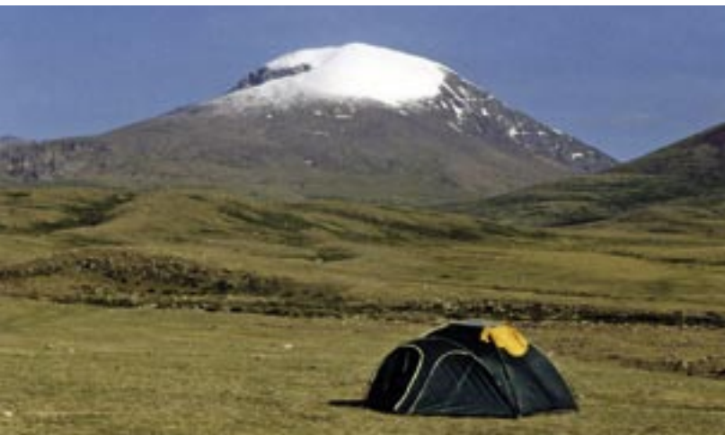
Der Otgon Tenger Gipfel von Osten.

Die Region um den Otgon Tenger ist eine Wanderlandschaft par excellence. Es gibt die Möglichkeit für Bergwanderungen mit der Besteigung von Gipfeln um die 3500 Meter, ebenso wie das anspruchsvolle hochalpine Erlebnis des Otgon Tenger selbst. Auf der Westseite und Nordseite findet man Wälder, Seen und Tundra, auf der Ostseite geht die Steppenlandschaft direkt in alpine Vegetation über.