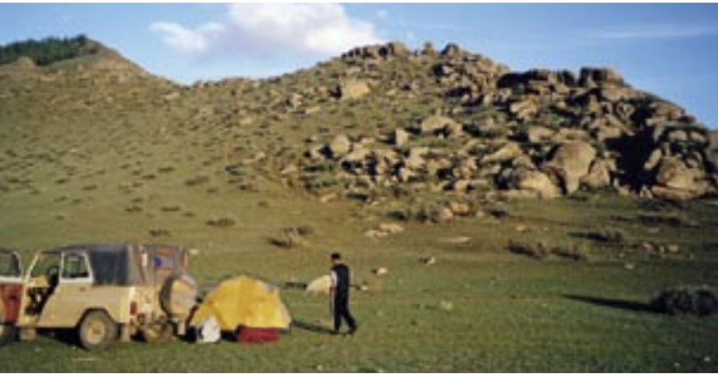
Lager im Zentral Changai.

Der Changai ist das zentrale Hochgebirge in der Mongolei und teilt im Süden die Wüstensteppenebene in die westliche und östliche Gobi. Vieles in der Geschichte und der Kultur der Mongolen dreht sich um den Changai. Im Changai haben alte, geheimnisvolle Völker ihre Spuren hinterlassen. Heute leben hier fast ausschließlich Chalch, also Zentralmongolen. Nationale Minderheiten findet man nicht.