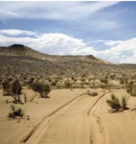
Die Tour führt über recht einsame Wege.

Eine anspruchsvolle Tour wird hier vorgestellt, die alle Landschaften der Mongolei zu bieten hat und bei der Abwechslung Programm ist. Von Ulaanbaatar fährt man zunächst wie bei der Tour G1 in Richtung Süden, über die Geierschlucht und den Chongrijn Els. Die Beschreibung dazu ist in der Tour G1 zu finden. Am Chongrijn Els trennen sich die Wege zur Tour G1, zunächst nimmt man noch etwa 10 Kilometer den Weg in Richtung Norden, nach Arwaicher, dann biegt man aber Richtung Westen ab. Es folgt eine Fahrt durch eine nahezu unbesiedelte Wüstenebene mit Saksaul-Sträuchern, Kameldornestrüpp und