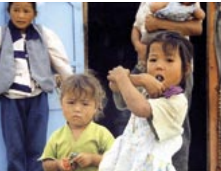
Die Bevölkerung in der Mongolei ist jung.

Das Bildungsniveau der mongolischen Bevölkerung ist recht hoch und das Analphabetentum, bis 1990 praktisch verschwunden, nimmt zwar wieder zu, liegt aber weiter unter 5 Prozent.