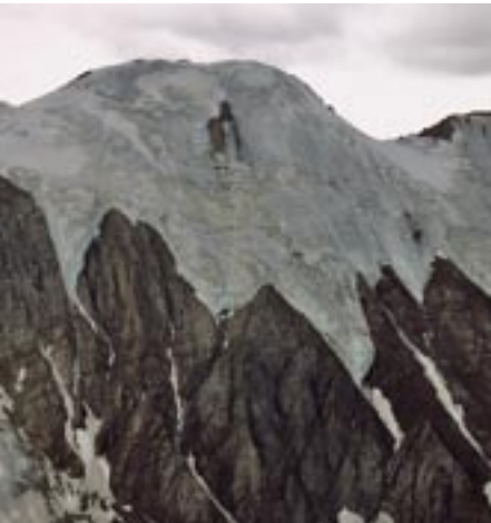
Blick auf den oberen Charchira Gletscher - Altai.

ckene Wüstensteppen finden, im Changai wesentlich weiter südlich gelegen Nadelwälder. Die Steppenlandschaft, so wie man sie sich hierzulande vorstellt, mit grünen Ebenen und weichen Hügeln, findet man zwar auch, aber sie dominiert nicht das Landschaftsbild der Mongolei. Man entdeckt hier Landschaft, die man Kanada oder Norwegen zuordnen würde, genauso wie bizarre Wüstenlandschaften und Seen, die fast schon kleine Meere zu sein scheinen. Das alles ist kräftig durchgemischt und wechselt manchmal auf engstem Raum. Am wenigsten abwechslungsreich ist die Landschaft der Chalch Ebene und der Ostgobi, also südöstlich von Ulaanbaatar. Hier herrschen Steppen und Halbwüsten vor, die Topografie ist nur wenig bewegt, es gibt keine Flüsse und nur kleinere Seen. Die größte landschaftliche Abwechslung bietet der Changai mit den angrenzenden Regionen. Hier kann man auf hundert Kilometern Hochgebirge, Taiga, Seen und Flüsse, Steppe und riesige Sanddünen erleben. Aber auch im hohen Norden mit dichter sibirischer Taiga und riesigen Sümpfen findet man immer wieder Täler mit Trockensteppe oder sogar Salzseen. Eines hat die mongolische Landschaft aber fast immer zu bieten: den freien Blick auf eine weite unverbaute Natur. Sieht man mal von den Folgen der Beweidung ab, sind 95 Prozent des mongolischen Territoriums Urlandschaft.