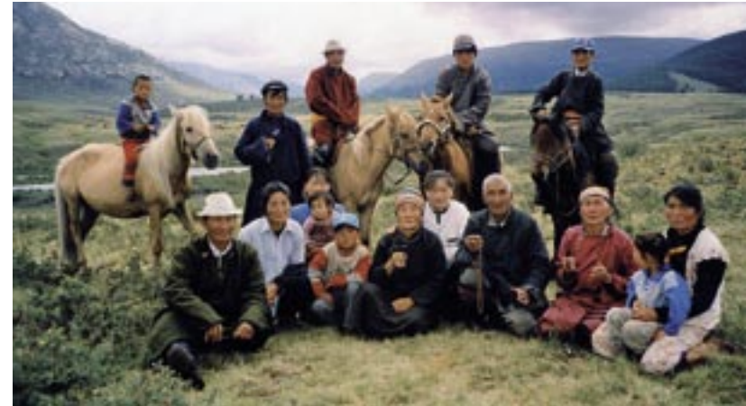
Mongolen sind stolz und wollen auch auf dem Foto würdevoll erscheinen.

Es existiert heute in der Mongolei eine kleine sehr wohlhabende Oberschicht, die in den wenigen Jahren seit der politischen Wende einen deutlichen Abstand zu übrigen Bevölkerung gewonnen hat. Aber auch das Lebensniveau der hauptstädtischen mongolischen Mittelschicht ist wesentlich höher, als das BIP pro Kopf als Indikator angibt. Das rührt zum Einen daher, dass diese Familien zur politischen und wirtschaftlichen Wende 1990 schon Besitz hatten, und es ist begründet in der Tatsache, dass in der Mongolei eine starke Schattenwirtschaft existiert, die nicht von der Statistik erfasst wird. Das tatsächliche BIP liegt in etwa um 20 bis 30 Prozent über dem statistisch erfassten, dass heute mit ei-