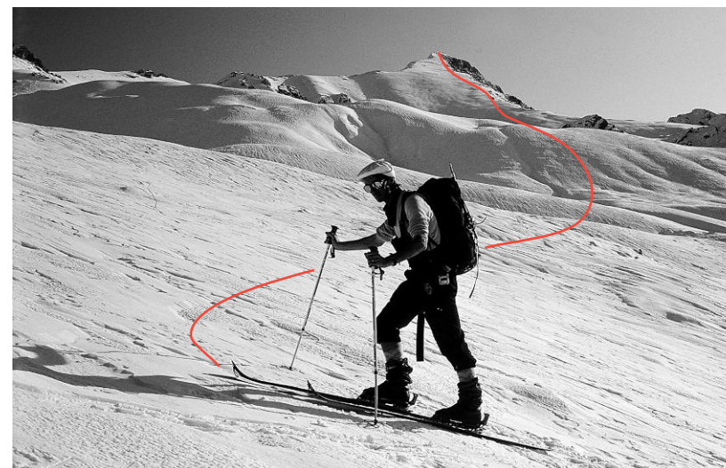
Il tratto superiore della salita all'Anticima Ovest del Monte Oserot.