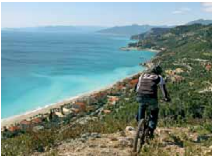
Typisch Finale: Meer und Strand vom Trail aus stets im Blick.

Ligurien im Allgemeinen und Finale Ligure im Speziellen vereint viele der unterschiedlichen, liebenswerten Aspekte Italiens auf engstem Raum: Die Menschen hier sind tüchtig und freundlich, die ligurische Küche zählt mit ihrer Kombination aus raffinierten Fischgerichten und bodenständigen Pasta- und Fleischgerichten zu den besten Italiens. Die Topographie und Natur ist atemberaubend: Die einsame, wunderschö-