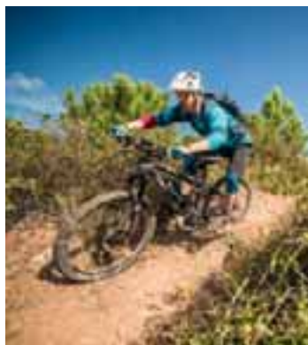
Weniger Trainierte können diese Tour auch mit dem E-Bike genießen.

Nun wird der immer noch breite Weg über weite Strecken eben und führt uns in eine andere Welt, die man hier so nicht erwartet: Almwiesen, Kühe, Nadelbäume und eine Aussicht auf die im Hinterland Reihe um Reihe gelegenen Zweitausender, die auch