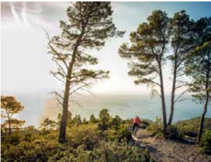
Die Finale-Formel, die glücklich macht: Trails, Sonne und Meer.