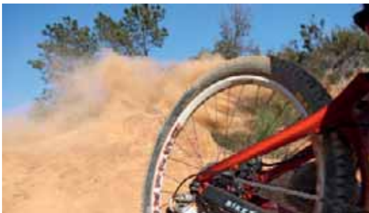
Finale-Style: Dirt und blauer Himmel.

Dieser Mountainbikeführer soll das Erlebnis Mountainbiken in Finale Ligure so leicht erreichbar wie möglich machen. Zu jeder Tour gibt es eine Kurzbeschreibung, die die Charakteristika der jeweiligen Tour knapp und prägnant beschreibt. Die folgende ausführliche Beschreibung bietet zudem Hintergrundinformationen, die mir als wissenswert oder unterhaltsam erscheinen. Um zum jeweiligen Startpunkt der Tour zu gelangen, nutzen Sie bitte die Übersichtskarte von Finale Ligure vorn im Buch. Für die Freeride-Touren empfiehlt es sich, auf die im Buch erwähnten Shuttleanbieter zurückzugreifen.