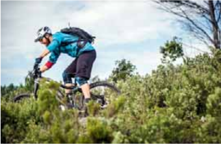
Kilometerlange Abfahrten entlohnen für die anstrengenden Anstiege.

im Hochsommer noch Schneereste offenbaren. Nach wenigen Kilometern und rund zwölfhundert Höhenmetern befinden wir uns im Alpenambiente, wenn auch mit südlichem Einschlag.